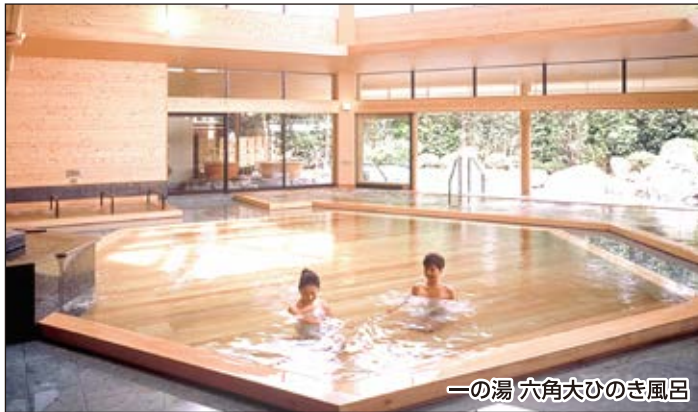
一の湯 六角大ひのき風呂