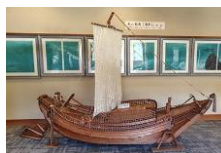
日本画五山の一人 東山魁夷の「唐招提寺御影堂 第1期障壁画『濤声』」と、北前船の精巧な模型9艘を展示