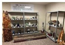
ポリウム感のある鉱物や 宝石の原石など

漢方薬の第一人者である宮澤俊郎氏が、中国西安博物館との交流の中で50年をかけて収集した鉱物を、71点展示しています。