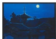
平山郁夫 月光斑鳩の里

ロビーから夢殿（本館温泉）に抜ける廊下には、平山郁夫の日本画や水彩画などを展示しています。